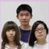
常葉大学造形学部 デジタルデザインコース 3年

1992年生まれ静岡県出身。清水南高校卒業後、3年間の浪人を経て東京藝術大学美術学部デザイン科に入学。映像表現を中心に、煙を使った表現を研究している。また在学中にミュージックビデオの監督などを務める。作品に「鼻声」(阪本奨悟)、「Re:Humanize - Sh0h × MES」がある。